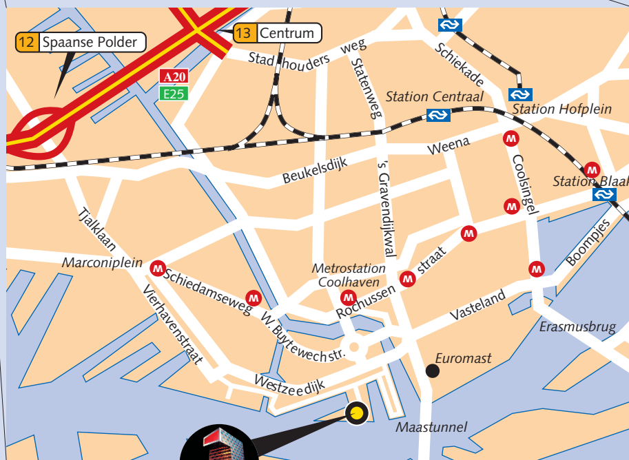
Locatie nieuwbouw, Lloydstraat